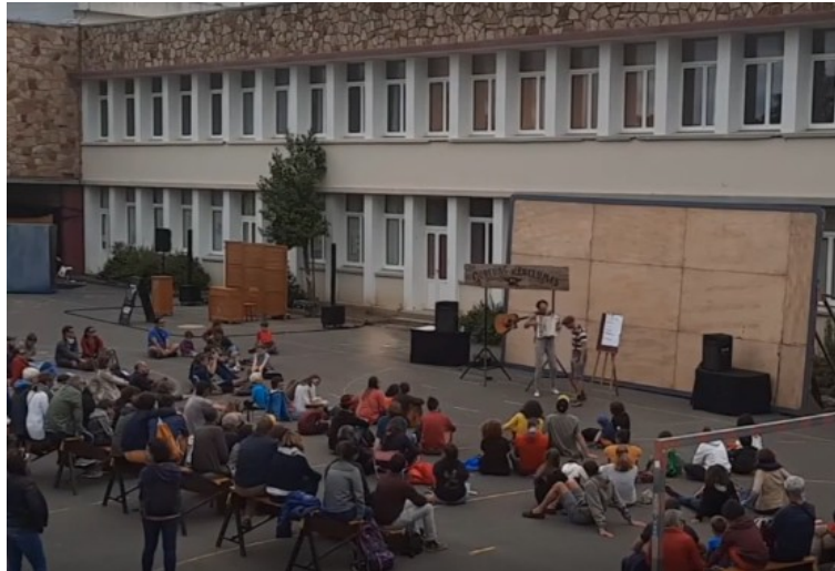
La Cour des Miracles à Brest