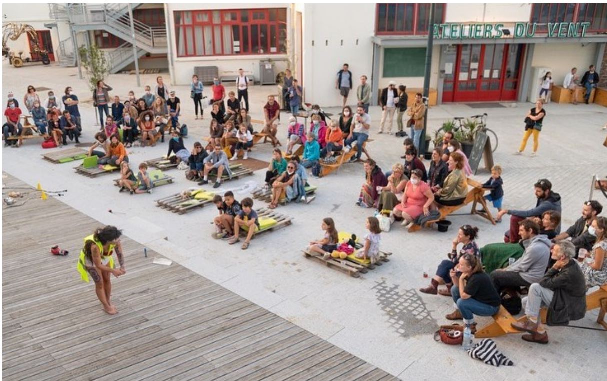
Bol d'R aux Ateliers du Vent à Rennes