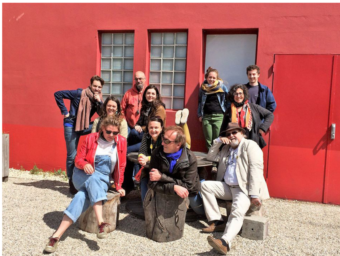
Le CA de la FéRue à l'Espace Périphérique

Le Conseil d'Administration s'est réuni une fois tous les mois et demi afin de faire le bilan des actions passées, de décider des orientations à prendre et de dresser un état des lieux de l'actualité du secteur. Mobile, le CA a organisé une réunion sur deux dans d'autres structures, également hors de Paris, pour aller à la rencontre de lieux et d'équipes afin de poursuivre son objectif d'être au plus prêt de ses adhérent-e-s tout en découvrant de nouveaux espaces de travail..