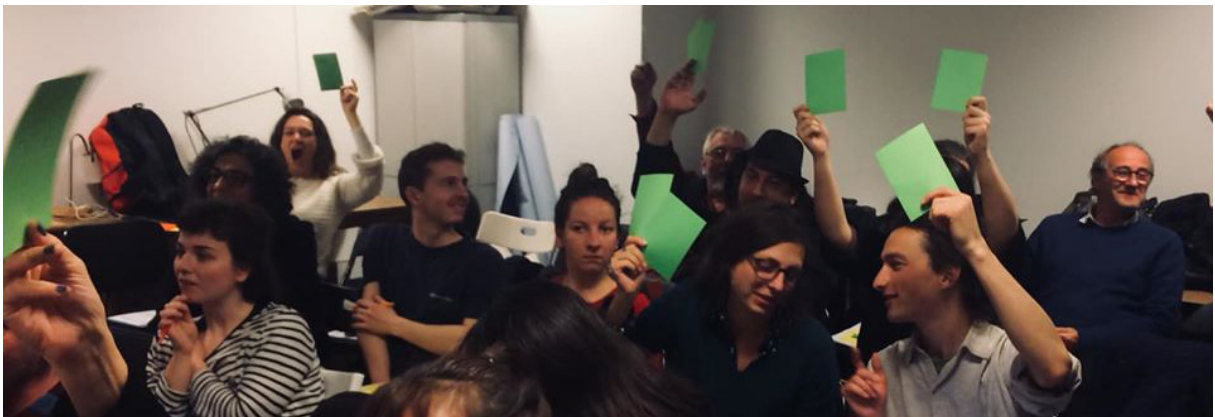
Assemblée générale 2019

Les adhérent·e·s de la FéRue représentent 21,27 % des adhésions globales nationales. En Île-de-France les adhésions sont les plus nombreuses, devant Grand'Rue (Nouvelle Aquitaine) avec 73 adhérent·e·s et la Fédé Breizh (Bretagne) avec 64 adhérent·e·s.