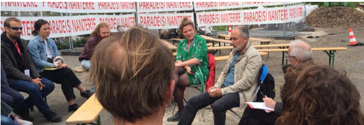
En pleine rencontre organisée à Parade(s) de Nanterre

Dans la dynamique de structurations des réseaux culturels et de mutualisation, elle a également été un relais auprès de ses adhérent·e·s des formations proposées par l'UFISC et est intervenue dans le cadre de certaines de celles-ci.