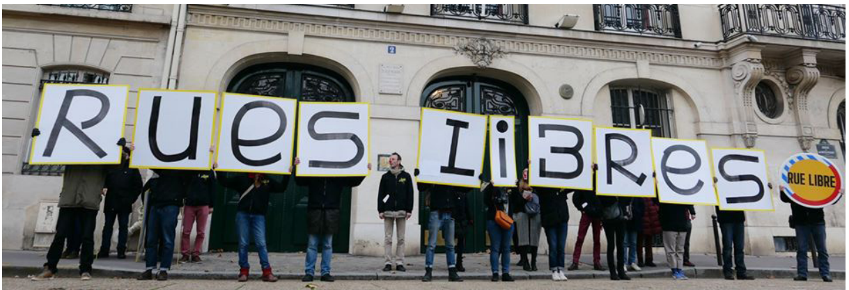
Devant l'ambassade du Chili avec l'abécédaire géant

Ces temps de création et d'action ont mobilisés près d'une soixantaine d'acteurs des arts de la rue et de sympathisant-e-s du secteur. Ils ont alimentés une réflexion globale sur le fond et la forme de Rue(s) Libre(s) qui se poursuivra en 2020.