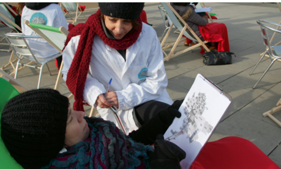
Opération divan, L'Agence nationale de psychanalyse urbaine, La Part-Dieu, Lyon, 2015 © Myriam Dumont – musée Gadagne.

de liens tout autant intimes que collectifs. Son rôle est d'œuvrer à la structuration de nos sociétés en même temps qu'à la construction de chacun d'entre nous dans sa dignité d'homme et de femme. D'où la nécessité d'une véritable diversité des pratiques et des contenus.