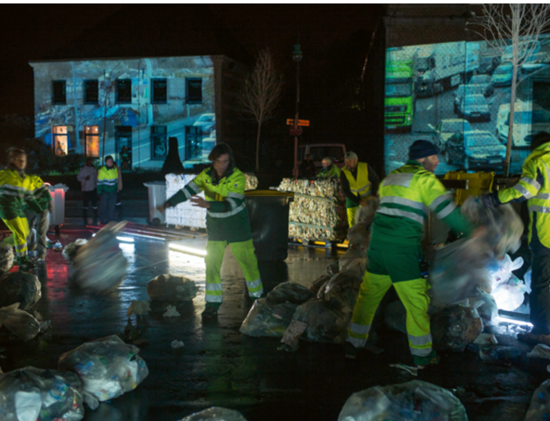
Do not clean , Cie Komplex Kapharnaum, Vieux-Condé, 2016 © Jean-Pierre Estournet.