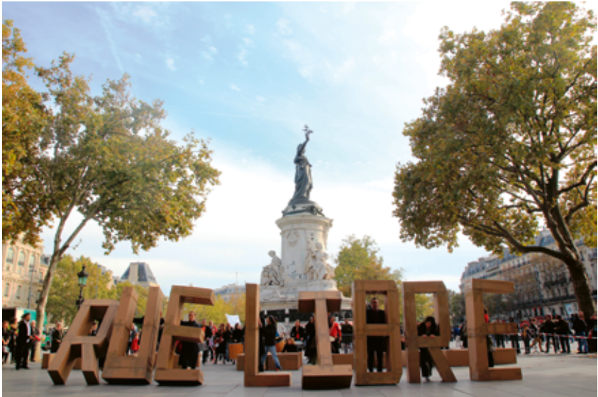
Rue Libre! © Jean-Michel Coubart.