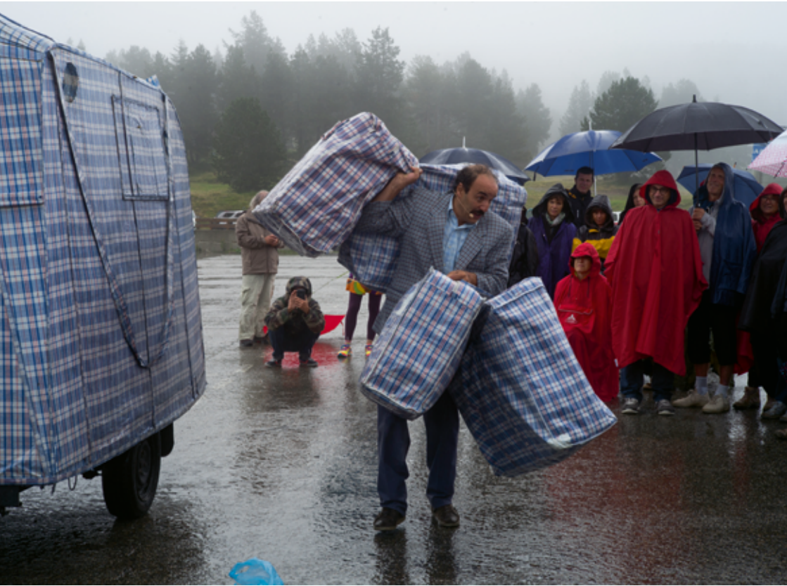
Tleta , Cie Une Peau Rouge, Ax-les-Thermes, 2015 © Jean-Pierre Estournet.