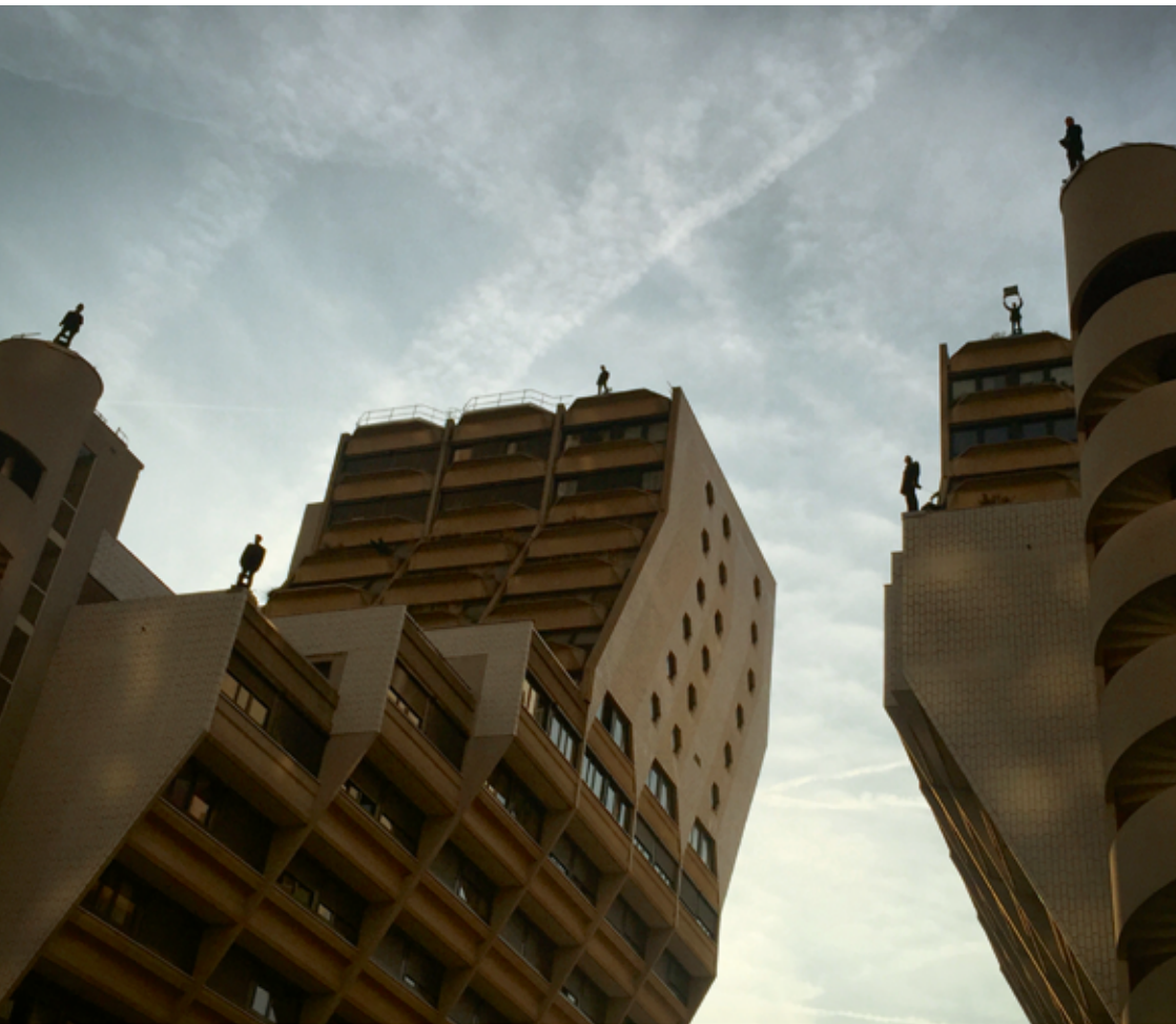
Les Regardeurs (aux Orgues de Flandres, Paris 19) Cie Les Souffleurs commandos poétiques, septembre 2016 © Olivier Comte.