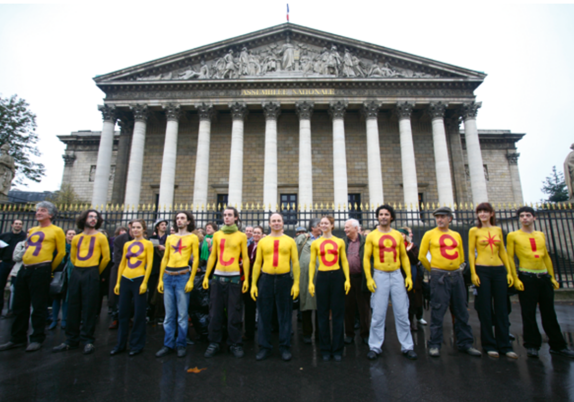
Rue Libre! À l'Assemblée nationale, 2009, Paris © Jean-Michel Coubart.

mission du ministère à la « démocratisation » des œuvres légitimées par l'État. Surtout, en réduisant le citoyen au spectateur, voire au consommateur, elle ignore à la fois les travaux de l'Unesco et la définition de la culture promue par la Déclaration universelle des Droits de l'Homme de 1948.